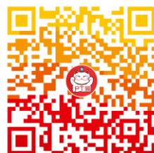
PT猫-能力验证小助手