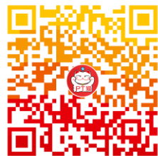
PT猫-能力验证小助手